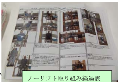
ノーリフト取り組み経過表

～マニュアルグループ・職場推進グループ～ 皆さんが職場内でノーリフトが実践できるように学習会や用紙検討を行っています。