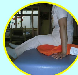
滑るように奥へ移動!! (起床時も活用)